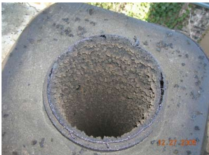
Такъв креозот лесно се отстранява с четка

Креозотът е лепкаво вещество ( сложна смес от смоли, сажди и други вторични продукти от горенето ) с неприятна миризма, лесно запалимо и с корозионно действие.